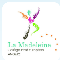
Collège privé La Madeleine Site Web