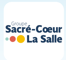
Lycée privé Sacré-Coeur Site Web

Ces établissements proposent des formations générales ou professionnelles. Les étudiants bénéficient d'un aménagement des horaires afin de concilier la pratique de haut niveau et les études.