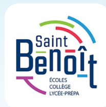
Lycée privé Saint Benoît Site Web